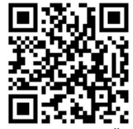
TEMATSKA KROŽNA UČNA POT