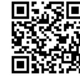
VRELEC ZA CO2 KOPEL