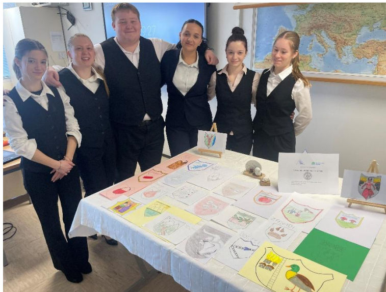
Slika 1: Sodelujoči dijaki