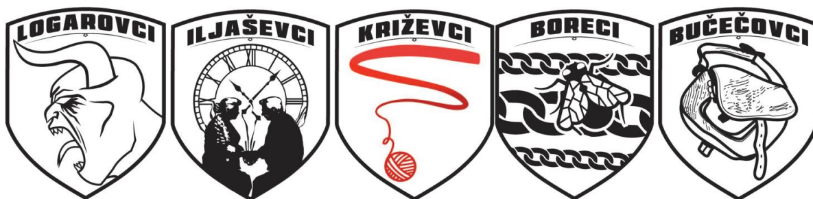
Slika 2: Vaški grbi v trendovski preobleki

Grbe smo oblikovali na »responsive« način, kateri nam kasneje omogoča več manevrskega prostora za nadgradnjo izdelkov. V pomoč so nam bila glasila občine ( Občina Križevci – Občina Križevci, 2025 ).