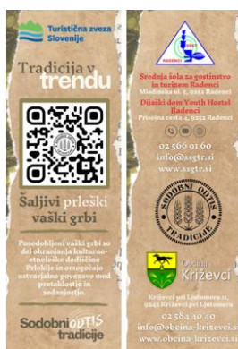
Slika 4: Kazalka