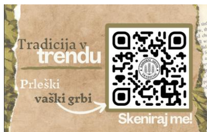
Slika 3: Vizitka